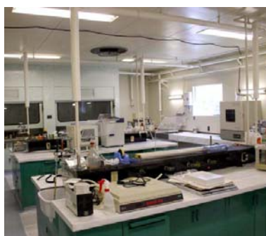
非密封 RI 取扱実験室